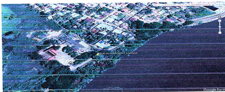
Imagen 1. Barrio yati frente al Matadero– Magangué